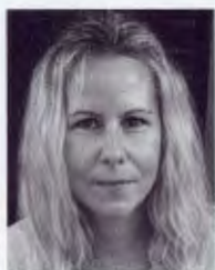
WE ARE SOCIAL